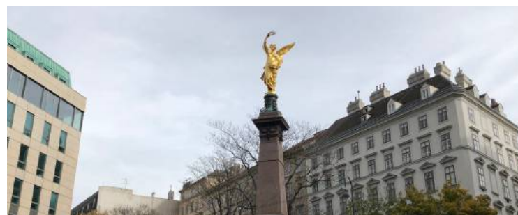
Triumphierend krönt Siegesgöttin Victoria das Liebenberg-Denkmal bei der Mölker Bastei.