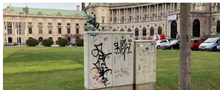
Helden waren das keine, die diese Schmiererei am Heldenplatz hinterlassen haben.