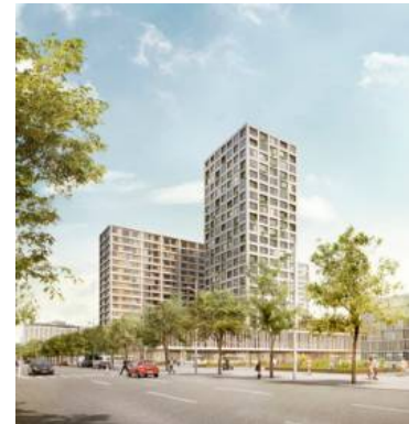
Das Heumarkt-Projekt ist umstritten.

„Eigentlich hätte uns die UNESCO schon heuer den Welterbe-Status Zentrum Wien aberkennen können. Deutliche Signale aus Regierungskreisen und unsere Aktivitäten haben das bisher verhindert.“